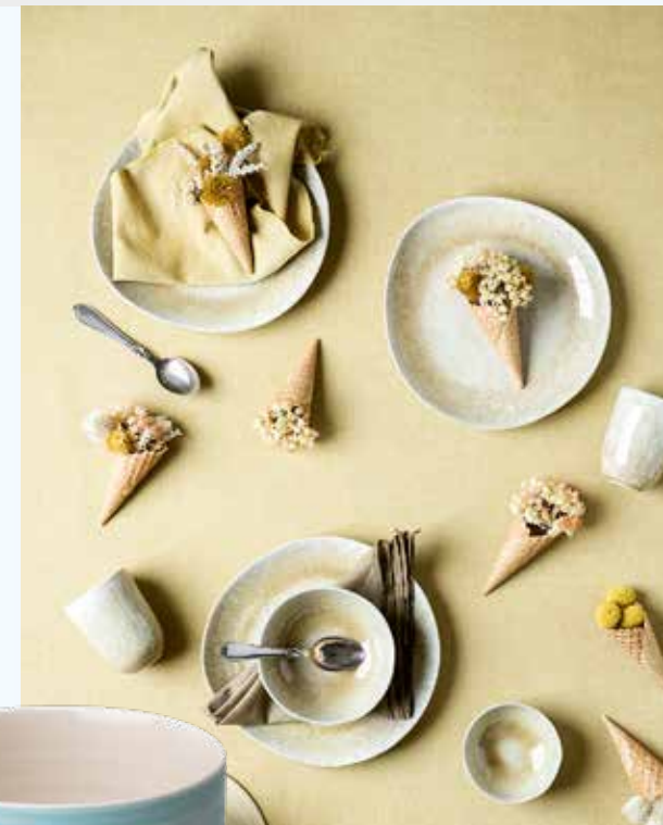
Geschirr | Bungalow | EUR ab 14,95 Becher aus Porzellan | Anna Sykora EUR 59,95 Mandeln mit Schokoladenüberzug, verschiedene Sorten | Sköna Ting EUR 6,95