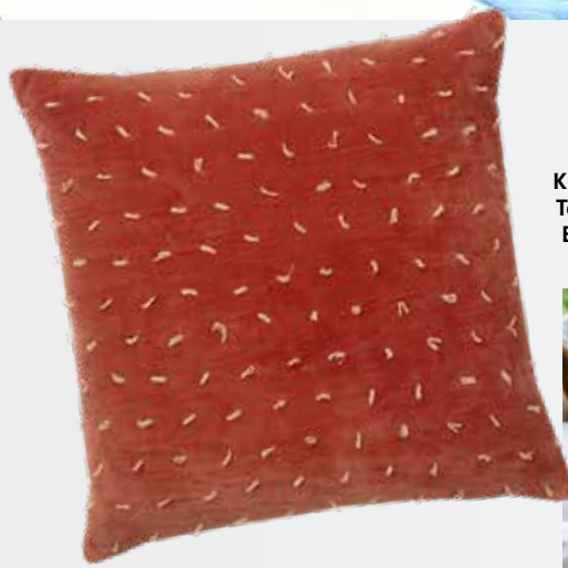
Kissenhülle Bindi Terracotta | Bungalow EUR 49,95