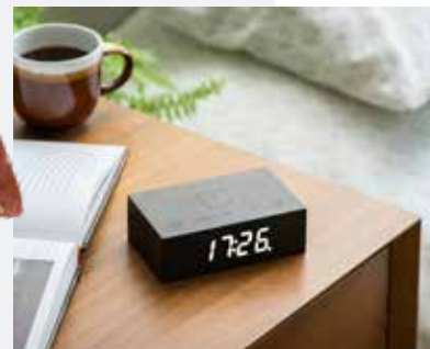
Wengè Schale mit Rasierseife 186g Acca Kappa | EUR 86,00 Flip Click Clock Wecker Gingko | EUR 49,90