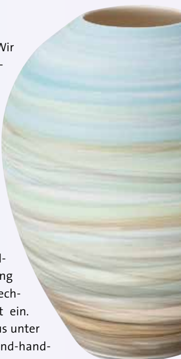
Anna Sykora Oben: Vase aus Porzellan EUR 139,00 Links: Trinkschale Seashell EUR 84,00

Wir sorgen für den Schutz Ihrer Gesundheit und setzen neben der Einhaltung aller aktuellen Auflagen zusätzlich High-Tech-Lüftungsgeräte zur Reinhaltung der Luft ein. Sie können auch bequem von zu Hause aus unter atalanda.com/bochum/vendors/design-und-handwerk-dickerhoff stöbern und bestellen. Folgen Sie uns auf Facebook und Instagram für die neuesten Trends und aktuelle Angebote.