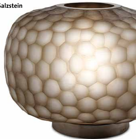
Tischlampe Erbse | GUAXS EUR 755,00