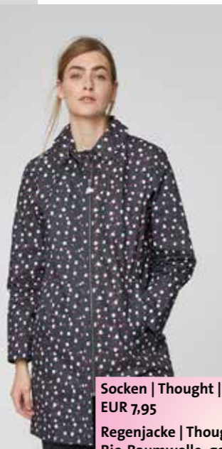
Regenjacke | Thought Bio-Baumwolle, gewachst, verschweißte Nähte | EUR 149,00