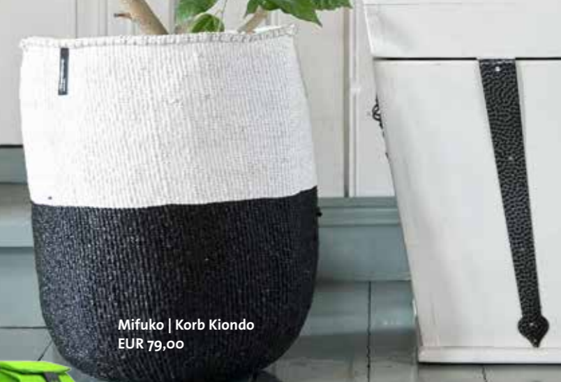
Mifuko | Korb Kiondo EUR 79,00