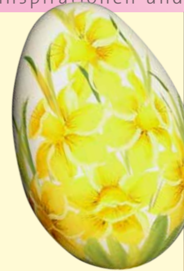
Gänseei, handbemalt | Slowakei EUR 10,95 Geschirrtuch | Bungalow | EUR 9,95 Babyrassel | ava & yves | à EUR 19,90