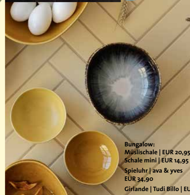
Bungalow: Mülschale | EUR 20,95 Schale mini | EUR 14,95 Spieluhr | ava & yves EUR 34,90 Girlande | Tudi Billo | EUR 7,50

Besondere Geschenke, ausgesuchte Home Accessoires, feine Kosmetik und noch viel mehr liefern wir ab sofort auch zu Ihnen nach Hause. Sie können entspannt vom Sofa aus durch unser Sortiment stöbern, sich schon mal inspirieren lassen und dann direkt lokal einkaufen, wir liefern (und Sie sparen sich den Gang in die Stadt) oder wir legen die Ware für Sie zurück.