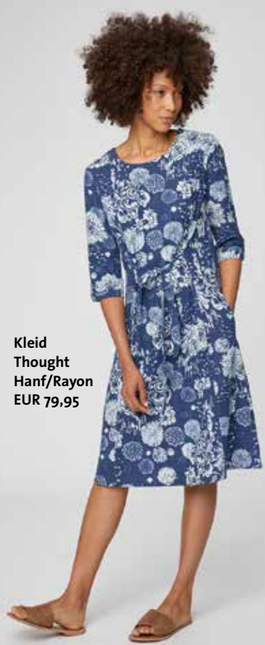
Kleid Thought Hanf/Rayon EUR 79,95

Die Stoffe aus Modal, Bio-Baumwolle, Tencel und recyceltem Polyester sind nachhaltig produziert und angenehm auf der Haut. Der junge frische Stil ergänzt unsere altbewährten ökologisch orientierten Label Lanius und Eve in Paradise perfekt!