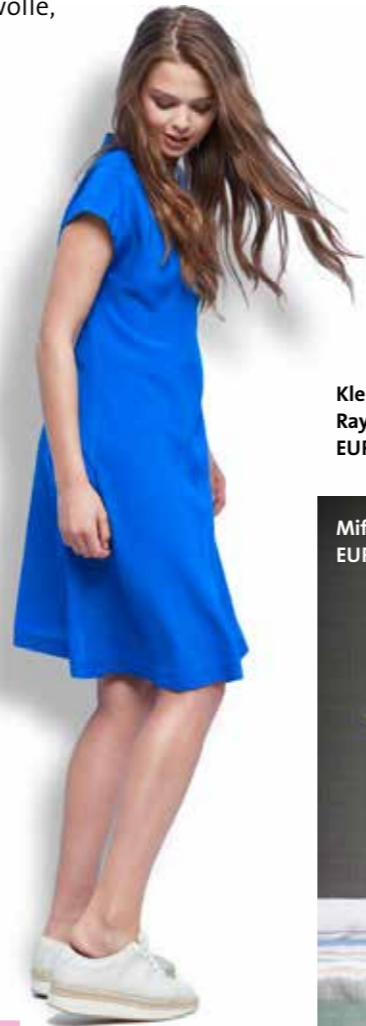
Kleid | eve in paradise Rayon/Viskose EUR 119,90