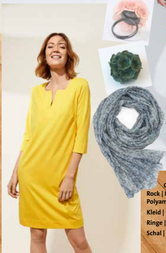
Oben, Mitte: Rock | FOX'S | Baumwolle/Polyester/ Polyamid/Elasthan | EUR 99,95 Kleid | FOX'S | EUR 139,00 Ringe | Ayuko Hishikawa | à 75,00 Schal | Djian | Seide | EUR 49,00