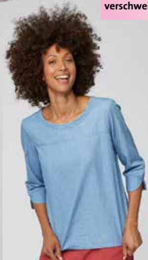
Thought | Shirt Bio-Baumwolle EUR 69,95