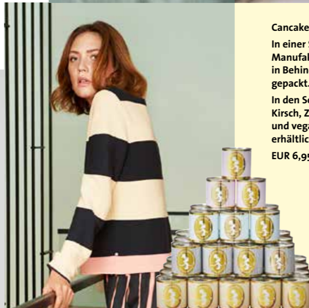
Pulli | Thought | Bio-Baumwolle/Wolle EUR 84,95 Pulli | Lanius | Baumwolle k.b.A. | EUR 119,90

Cancake, Kuchen in der Dose mit Kerze. In einer Schwarzwälder Manufaktur gebacken und in Behindertenwerkstätten gepackt. In den Sorten Schwarzwälder Kirsch, Zitrone, Schoko und veganem Apfelstrudel erhältlich. EUR 6,95