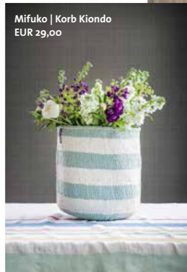
Mifuko | Korb Kiondo EUR 29,00