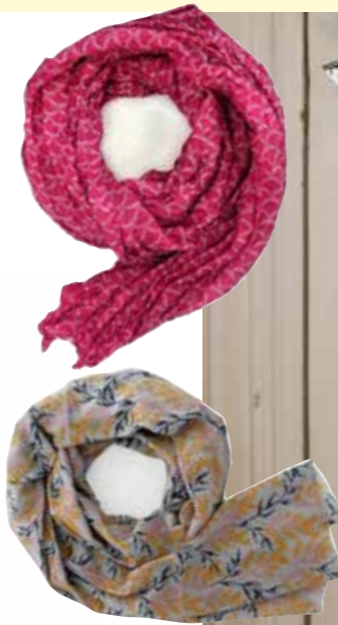
Schal, pink | Djian | Seide EUR 49,00 Schal, blau mit Muster | Djian Bio-Baumwolle | EUR 25,00